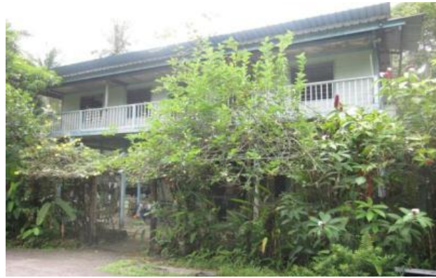
Double-storey kampung house