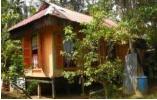
Single-storey kampung house