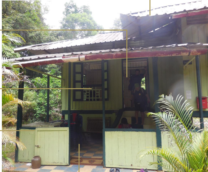
Hse No. 760D View at Anjung

தாழ்வாரத்திற்கான மர அரை வாயில் (அன்ஜுங்)