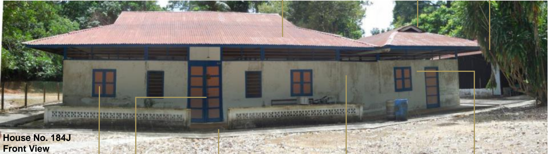
House No. 184J Front View

Tandas / bangsal yang berasingan தனி கழிவறை / கொட்டகை