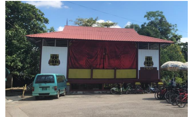
Places of Interest