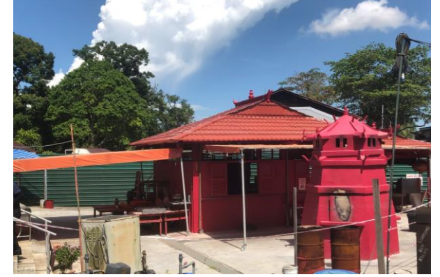
Places of Worship